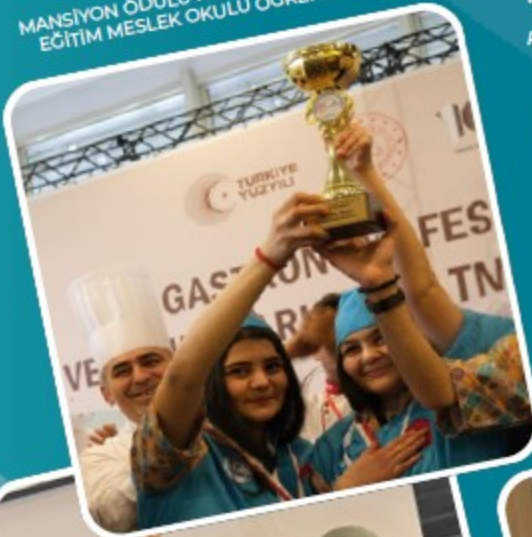
MEB GASTRONOMİ FESTİVALİ VE YEMEK YARIŞMASI MANSİYON ÖDÜLÜ KONYA KARATAY ÖZEL EĞİTİM MESLEK OKULU ÖĞRENCİLERİ